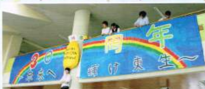
巨大壁画モニュメントの制作