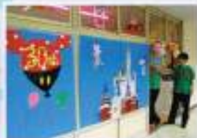
アイデアいっぱい、クラス展示