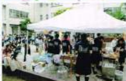
中庭は大盛況、クラス模擬店