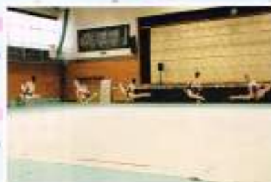
「優雅に、そして高く、新体操部」