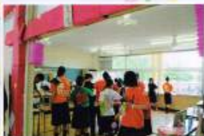
無機をくぐると…クラス展示