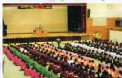
開会式、色どりのクラスシャツで